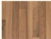
Nuß Butscherblock 3324 PE