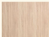
Sonoma Eiche hell 34038 AT