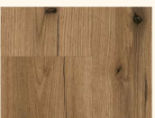
Eiche Evoke Sunset K5574 AW