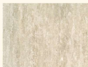
Tibur 37910 PE