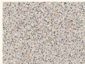
Ravenna Grau 3952 PE