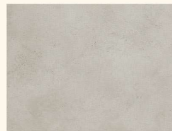
Naturstein 38356 DC