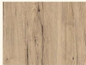
Sanremo Eiche Sand* 34139 AW