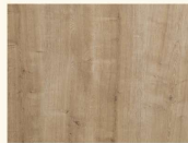
Chalet Eiche 35252 AT