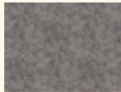
Beton Art 37905 DP