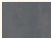
Oxid 34321 DP