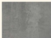
Beton Art Perlgrau 44375 DP