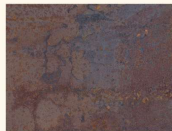
Rustry Iron K4398 DP