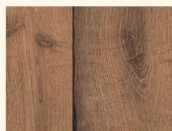
Eiche Antique Expressive K4447 AN