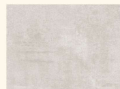
Beton Art Opalgrau* 44374 DP