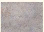
Oldstone 45273 DC