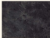
Schiefer 3953 PE