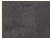
Rustry Iron Ocean K4399 DP