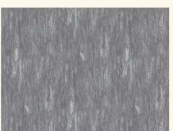
Black Sky Light K5577 DP