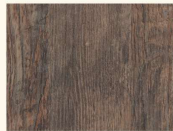
Laramie Pine 34318 AT