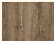
Arizona Pine* 34232 AT